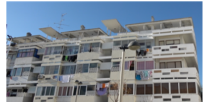
12. Edifício Residencial / Residential Building Rua de Olivenca