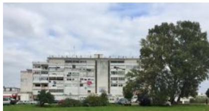
16. Conjunto / Housing blocs "Siroco" - Blocos Habitacional