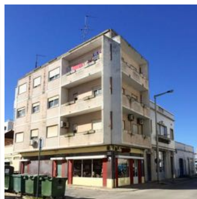
20. Modernismo & Interpetação Moderna (a direita - Coelho Building / Modern Housing blocs (building right) Arq. H. Carapato Rua 18 de Junho 243A - 1949)