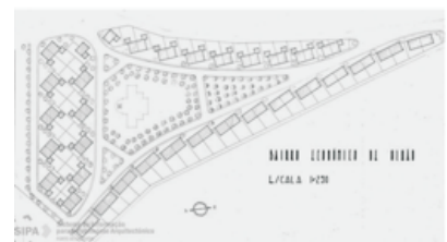
18. Bairro Económico / Social Housing CPCP Arq. E. Correia for DGEMN (1935-38)