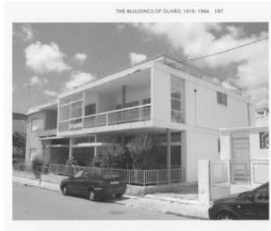
10. Casa Matos / House Rua de 'O Algarve' no. 22 Arquitecto Manuel Gomes da Costa (1957-58)