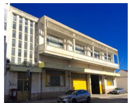
21. Garagem & escritórios / Garage and office EVA transportes Rua 18 de junho