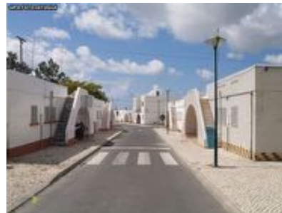
14. Bairro de Casas para Pescadores / Fisherman Houses Arquitecto I.P. Fernandes for DGSU (1945-49)