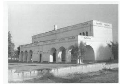
15. Escola Primaria / Primary School no Bairro de Casas para Pescadores Arquitecto I.P. Fernandes for DGSU (1948-51)