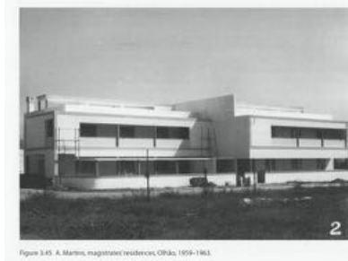
11. Residences / Houses para Magistrates Rua de Olivenca Arquitecto A. Martins (1959-63)