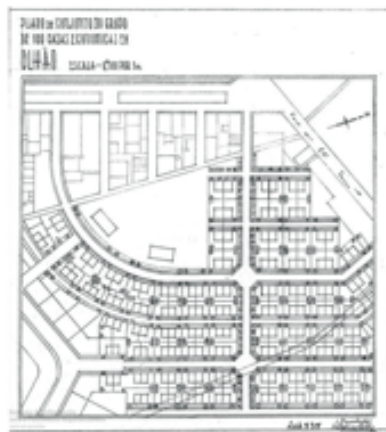
13. Bairro / Neighborhood Eng. Duarte Pacheco / Horta da Cavalinha Arquitecto Eugénio Correia (1948-53)